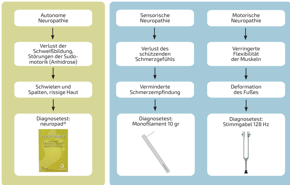
C-Nervenfasern (ohne Myelinschicht) Neuropathie